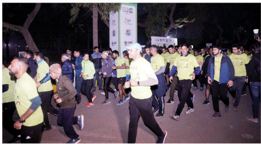
உலக பருவநிலை மாற்றத்துக்கு எதிராக, தில்லி தேசிய உயிரியல் பூங்காவில் குாமிற்றுக்கிழமை நடைபெற்ற விழிப்புணர்வு மாரத்தான் போட்டியில் பக்கேற்கவர்கள்.