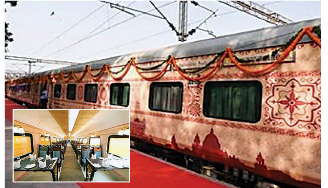
குஜராத்துக்கு ஆன்மிக சுற்றுலாச் செல்லும் பாரத் கௌரவ் ரயில்.